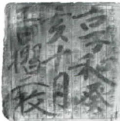
極楽寺瓦経 (市指定文化財) 姫路市教育委員会蔵