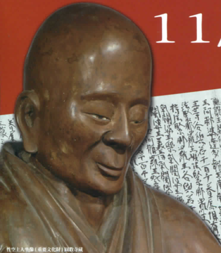
性空上人坐像(重要文化財)圓教寺蔵