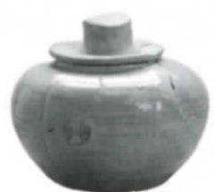
滝の奥経塚白磁合子 (市指定文化財) 神戸市教育委員会蔵