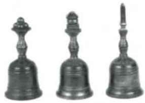
金剛鈴 (県指定文化財) 石籠寺蔵