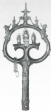
妙楽寺密教法具圓杖 (県指定文化財) 豊岡市教育委員会蔵

“中世は宗教の時代であった”と言われます。飢餓・疫病・戦乱がうち続く中、仏法を通じて現世の平安と来世の救済を願う観念が、民衆の間に深く浸透しました。そうした信仰を具体的にあらわしたものに、経塚や供養墓・地鎮具などの埋納品があります。地下に納められたこれらの品々には、当時の人々の願いや祈りが込められているのです。また、古代以来の伝統的な寺院が、大衆に開かれた寺院へと転身していったのもこの時代です。西国三十三所観音巡礼に代表されるように、民衆による霊場めぐりが一般化し、県内の古刹に伝わる各寺の開創伝説や高僧信仰にまつわる仏具・法具からは、当時の信仰の有りがうかがえます。本展は、平安時代末の経塚遺宝をはじめ現世・来世の利益を願って埋納した数々の考古資料を展示し、中世民衆信仰のすがたを紹介しようとするものです。