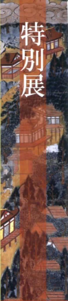
夢遊曼茶羅 中山寺蔵