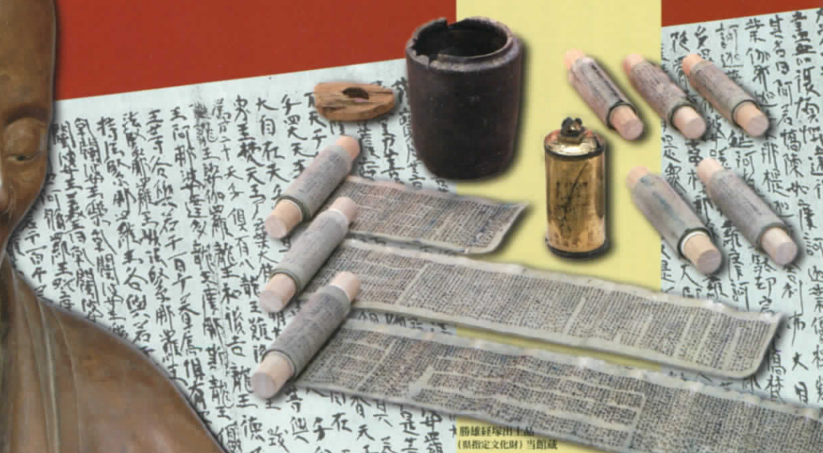
勝雄経學博士画(県指定文化財)当館蔵

Hyogo Prefectural Museum of Archaeology 兵庫県立考古博物館