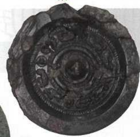
四乳八禽鏡 (宇佐市川部遺跡 南西地区墳墓群)