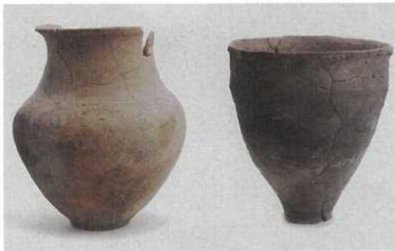
壺・刻目突帯文甕 (中津市古戸遺跡)