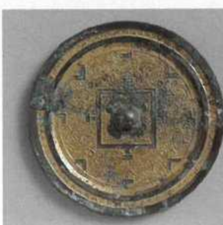
鍍金方格規矩獣紋鏡