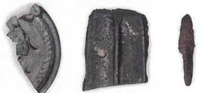
小型仿製鏡・銅鈴・銅鏃(豊前市鬼木四反田遺跡) ＜豊前市指定文化財＞