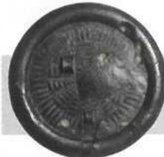
多紐細文鏡(佐賀市増田遺跡) ＜佐賀県指定文化財＞