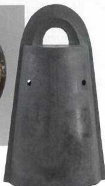
袈裟襷文銅鐸R (神戸市桜ヶ丘町出土)