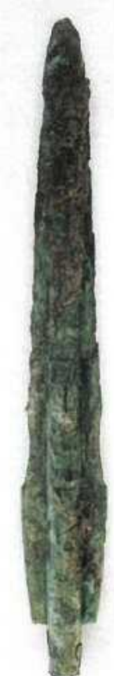
細形銅剣 (吉野ヶ里遺跡)