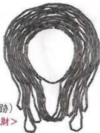
碧玉製管玉 (尼崎市田能遺跡) ＜兵庫県指定文化財＞