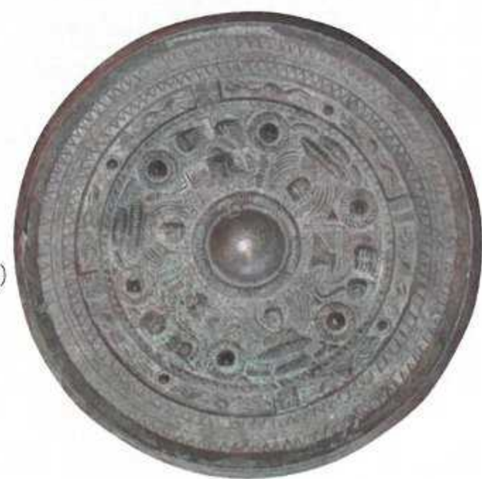
振文鏡(上毛町西方遺跡) 三角縁神獸鏡R(宇佐市赤塚古墳)