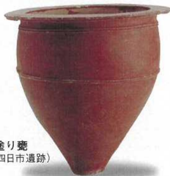
丹塗り甕 (玖珠町四日市遺跡)