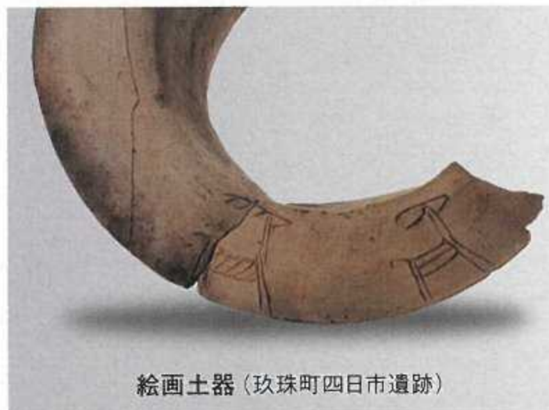
絵画土器(玖珠町四日市遺跡)