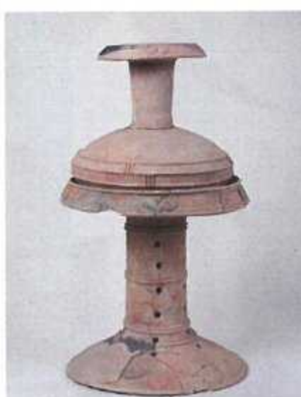
装飾壺・装飾器台 (赤穂市有年原・田中遺跡) ＜赤穂市指定文化財＞