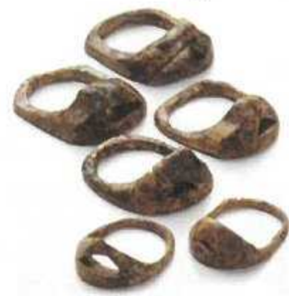
鹿角製指輪(神戸市新方遺跡)