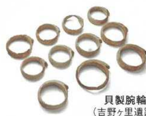
貝製腕輪 (吉野ヶ里遺跡)