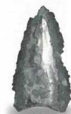
銅鏃 (中津市古戸遺跡)