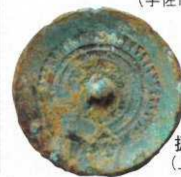
振文鏡 (上毛町西方遺跡)