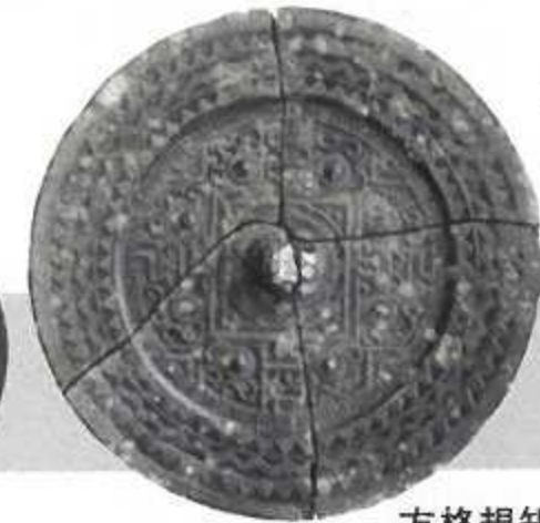
方格規矩四神鏡 (佐賀市尼寺一本松遺跡) ＜佐賀市指定文化財＞