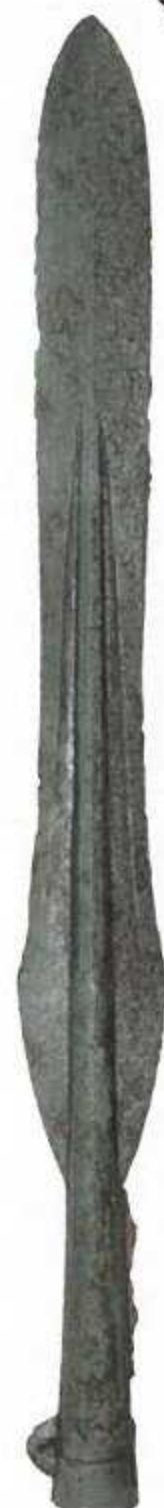
中広銅矛 (宇佐市切寄遺跡)