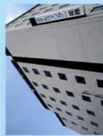
神戸中央区臨浜海岸通1-1-1(HAT神戸内)