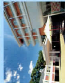
ホテル北野プラザ六甲荘 ホテルヴィンゲンタンナーショナルホテル