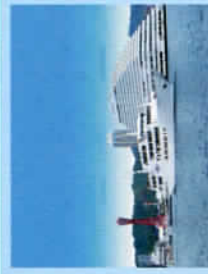
神戸クルーズターミナルコンチエルト