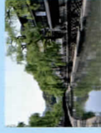
兵庫県立美術館王子分館