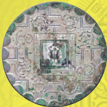
左) 方格規矩蟠螭紋鏡 / 前漢時代 / 当館蔵