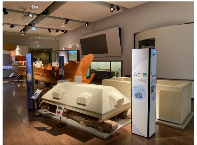
写真2 テーマ展示室その2 (石棺と古代船をご覧ください。)