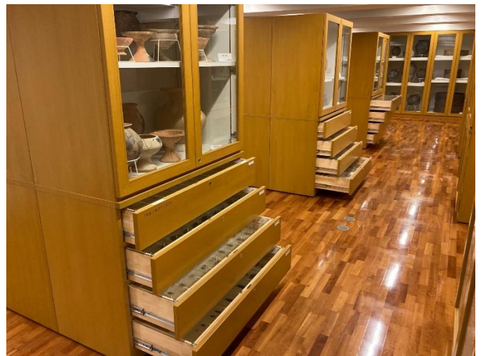
写真6 収蔵展示 (引き出しを開けると、石包丁などを間近にご覧いただけます。)