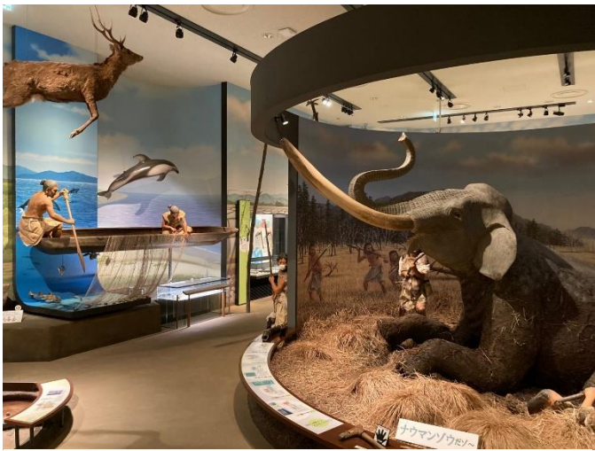
写真1 テーマ展示室その1 (ナウマン象がお出迎え)