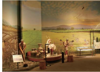
やよいじだい ねんまえ 弥生時代 2100年前