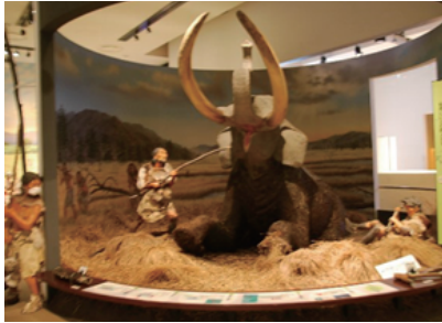
きゅうせっきじだい まんねんまえ 旧石器時代 3万年前