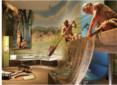
じょうもんじだい ねんまえ 縄文時代 3500年前