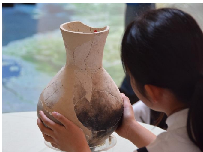
写真10 土器にふれよう