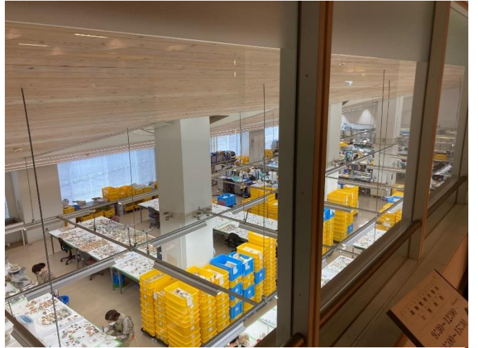
写真4 バックヤードデッキ (土器の整理作業を観覧できます。)