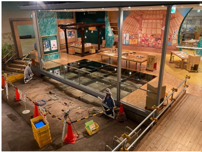
写真3 発掘ひろば (ハンズオン展示)