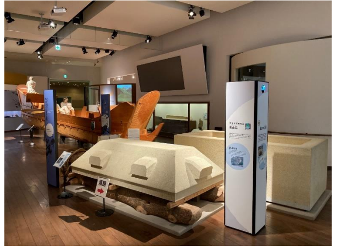
写真2 テーマ展示室その2 (石棺と古代船をご覧ください。)