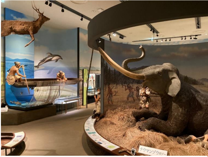
写真1 テーマ展示室その1 (ナウマン象がお出迎え)