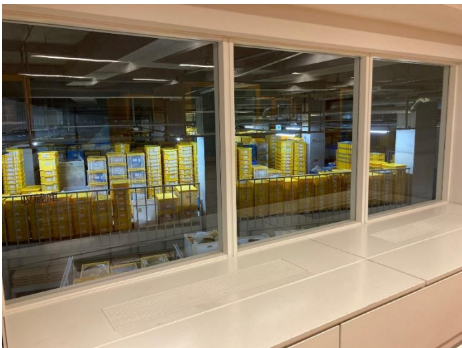
写真5 一般収蔵庫 (1万箱の土器等を収蔵した収蔵庫を観覧できます。)