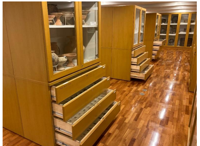
写真6 収蔵展示 (引き出しを開けると、石包丁などを間近にご覧いただけます。)